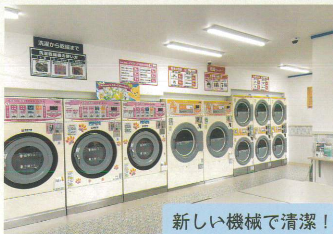
新しい機械で清潔！